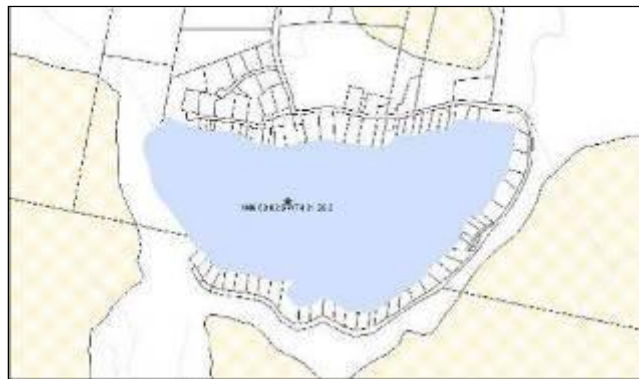
Carte de localisation du site échantillonné au lac Sauvage dans le cadre des études d'eutrophisation effectuées en 2009 (N 46°03'02.4" / W 074°31'26.5").

En considérant la présence de l'association des propriétaires du Lac-Sauvage, les besoins environnementaux liés au lac Sauvage sont généralement rapidement communiqués à la municipalité pour ensuite être étudiés. Il est donc toujours intéressant que les riverains s'impliquent et proposent eux-mêmes les solutions qu'ils trouvent adaptées à la réalité de leur lac.