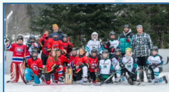
2 e Édition de la Classique hivernale intermunicipale